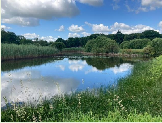
Figuur 1 In 2004 hersteld ven met daarin HR soort drijvende waterweegbree (locatie 1)