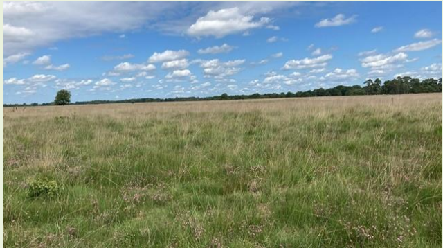
Figuur 3 Leefgebied van paapje (locatie 5)

Op locatie 5 zit VR soort paapje met 8 tot 10 territoria (figuur 3). Het werkelijke aantal broedparen ligt vermoedelijk lager waarbij nog geen beeld is van het broedsucces. Dit moet uitgezocht worden in het N2000 beheerplanproces. De trend in het Drents-Friese Wold is door de genomen maatregelen licht positief tot stabiel in afwijking van de landelijke, dalende trend. In 2024 is een nest van paapje aangetroffen met misvormde jongen (o.a. kapotte poten). Onduidelijk is wat de oorzaak daarvan is en of het dezelfde oorzaak is als bij mezen (kalkgebrek door verzuring).