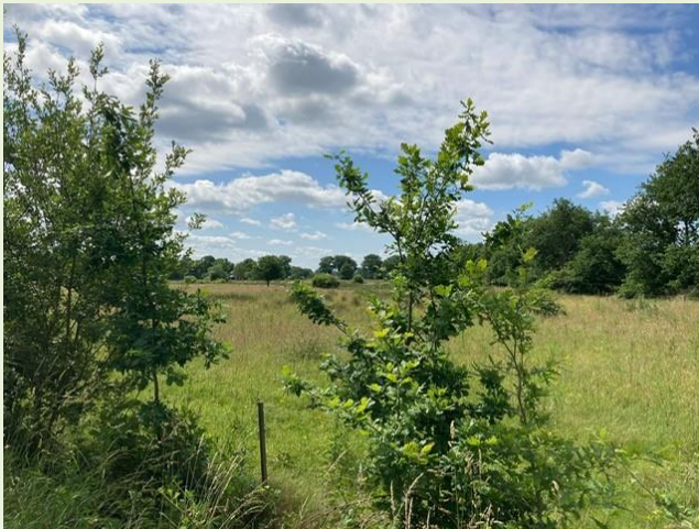
Figuur 4 Begrazing met ossen en ander ouder vee waar tot nu geen aanvallen en uitval door wolf is geweest (locatie 3)

Voor Natura 2000 is dit van belang om te weten zodat inzichtelijk is hoe verschillende habitattypen indien nodig begraasd kunnen worden zonder dat de dieren direct ten prooi vallen aan de wolf.