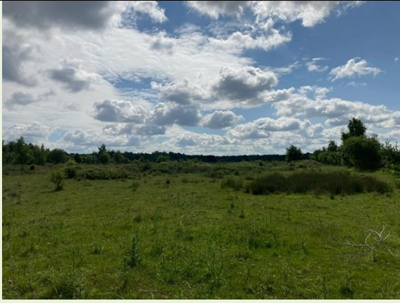
Figuur 4 Vroomeveld - habitat VR soort grauwe klauwier (locatie 2)