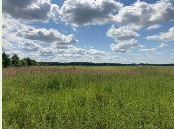
Figuur 5 Extra perceel wat toegevoegd wordt aan begrazingseenheid Vroomeveld tbv grauwe klauwier (locatie 2)