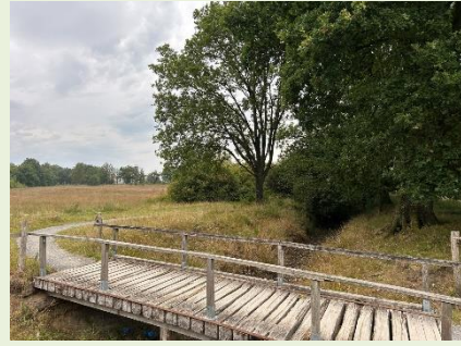
Figuur 2 Locatie2: Tankgracht

Het tweede punt van aandacht betreft de aanwezigheid van de tankgracht uit WOII op het Balloërveld. In het Natura 2000-beheerplan staat dat deze moet worden gedempt of afgedamd. Staatsbosbeheer heeft een voorstel uitgewerkt om de laagste delen van de tankgracht, zoals bij locatie 2, te dempen. Hierdoor wordt de opbolling van het grondwater weer gelijk getrokken aan het reliëf van het maaiveld, waarbij uittreding van grondwater cq ondiepe grondwaterstanden mogelijk zijn op de randen van het Balloërveld.