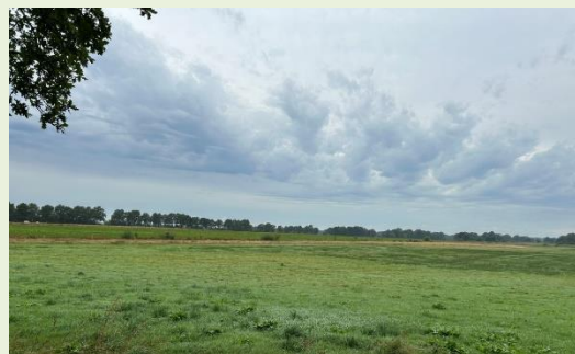
Figuur 1 Locatie1: Links maisakker, rechts N12.02

Ook is de belasting van meststoffen en gewasbeschermingsmiddelen merkbaar. Op een deel van het perceel worden lelies geteeld met een relatief hoog water- en middelengebruik. Vanuit het perceel bij locatie 1 (figuur 1) vindt afspoeling plaats van landbouwwater richting een perceelsloot waarna het zich mengt met het water van het Smalbroekenloopje. Dit leidt tot belasting van het loopje, terwijl via de sloot tevens kwelwater uit het naastliggende, ingerichte perceel (N12.02) en iets verderop gelegen vochtige heide wordt afgevoerd.