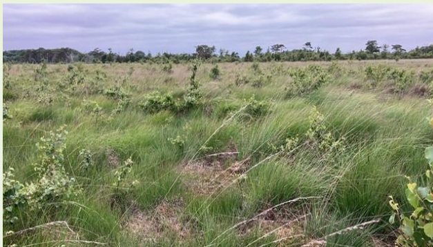
Figuur 1. Droog hoogveenlandschap met veel opslag (locatie 2)

Droogte en verdroging is voor het instandhoudingsdoel Hoogveenlandschap (H7110A*) een groot probleem. Het is nu zelfs zo droog dat het beloopbaar is. Dit is veel te droog voor dit habitatype en daarmee gaat de kwaliteit sterk achteruit. De oorzaak zit vermoedelijk in de lage regionale grondwaterstand. Bij locatie 2 (figuur 1) is het op het moment van het veldbezoek zo droog dat er gelopen kan worden. Zelfs in februari 2025 was het beloopbaar. De omstandigheden voor dit deel van terrein horen zo nat te zijn dat er niet gestaan kan worden.