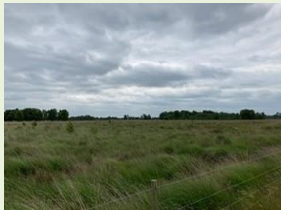
Figuur 3. Toename opslag in pingo (locatie 1)