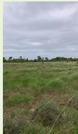
Figuur 2. Nattere situatie in hoogveenlandschap waardoor minder opslag

Het veenhooibeestje is een typische soort van o.a. de habitattypen Hoogveenlandschap (H7110A*) en Herstellende hoogvenen (H7120). Deze soort is verdwenen uit het Witterveld. In N2000-gebied Bargerveen wordt