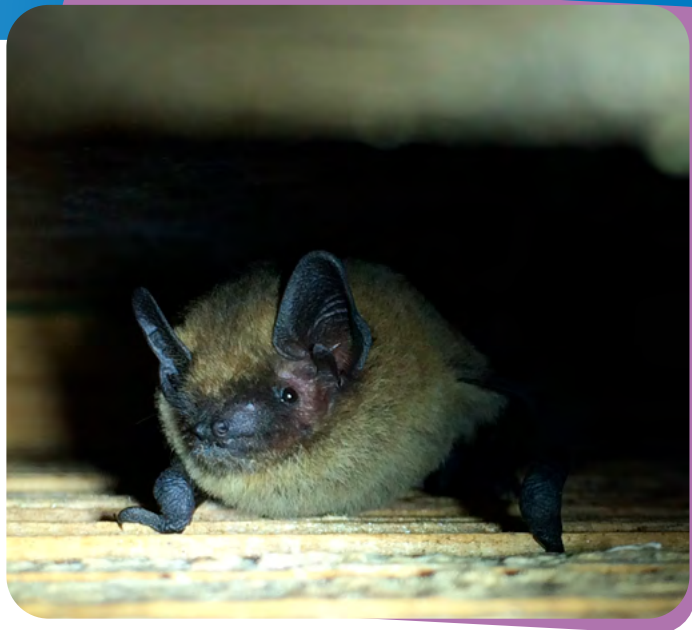
Gewone dwergvleermuis © Saxifraga-Jeroen Willemsen.

van bestuursrechtelijke handhaving. Toezicht heeft ertoe geleid dat 2 keer een proces-verbaal is opgemaakt. De inzet van eDNA en de uitvoerbaarheid in de praktijk heeft het afgelopen jaar de nodige uitdagingen in het kader van toezicht met zich meegebracht. De eDNA regeling is een methode waarbij met behulp van DNA-onderzoek wordt vastgesteld of beschermde dieren in een gebied aanwezig zijn. De eDNA-regeling heeft geleid tot een toename van het aantal handhavingsszaken. Er zijn 223 reguliere controles uitgevoerd. Naar aanleiding van deze controles zijn er 6 waarschuwingsbrieven verzonden en is er 1 last onder dwangsom opgelegd. Er zijn geen handhavingverzoeken ingediend. De naleving en handhaving van de gewijzigde regelgeving vragen hierdoor meer inzet en capaciteit.