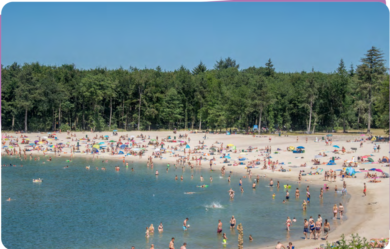
Zwemplas 't Gasselterveld

Regulier toezicht is uitgevoerd volgens de Omgevingsverordening. Er zijn geen onregelmatigheden geconstateerd.