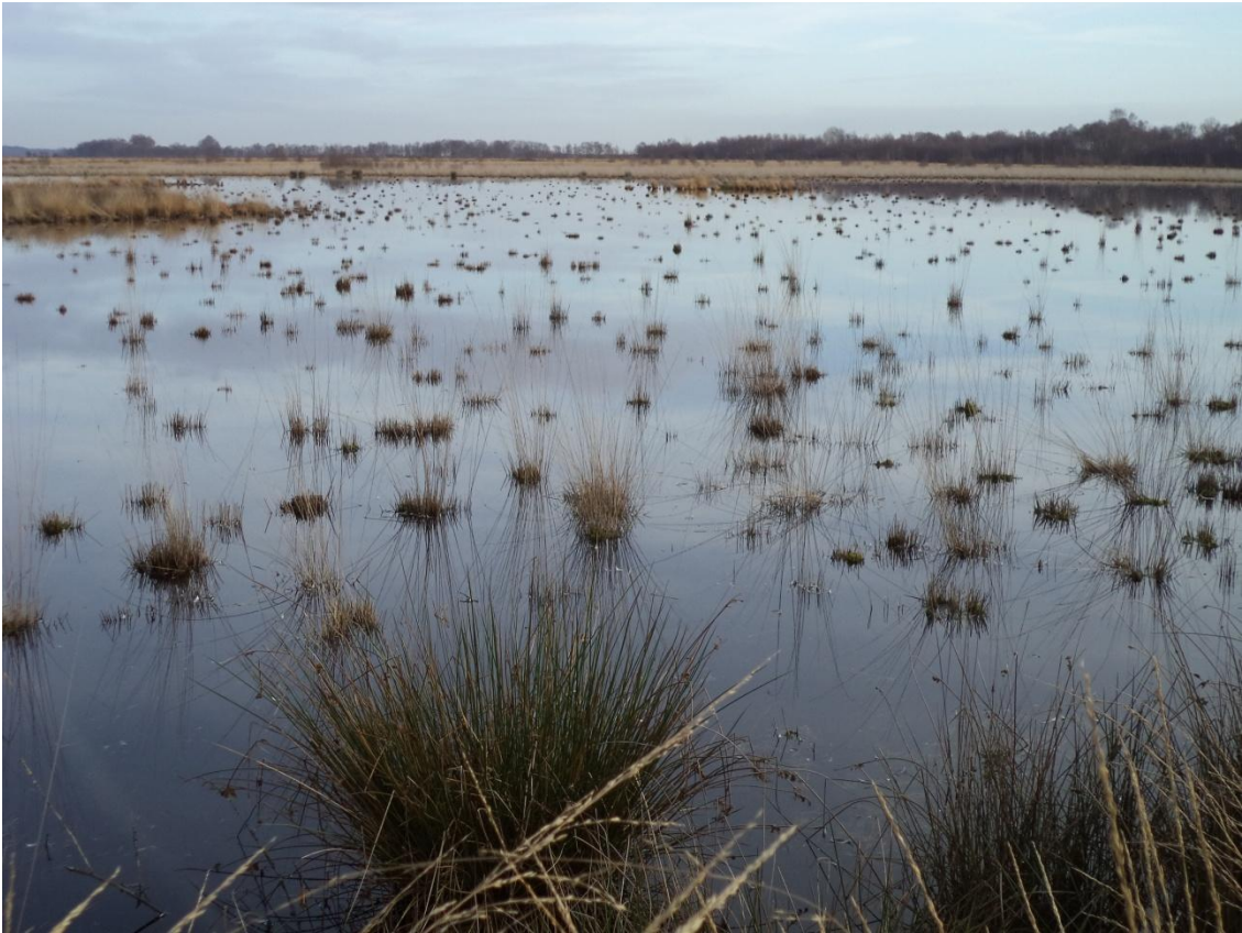
Foto 2.3 Open water met hier en daar Pijpenstrootje in het deelgebied Kleine veen in het Fochteloërveen.