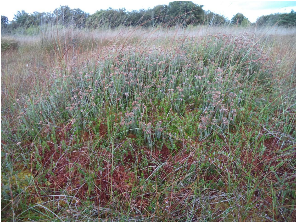
Foto 2.1 Hoogveenbult met Hoogveen-veenmos en Grote veenbes in het deelgebied noordhoek in het Fochteloërveen.