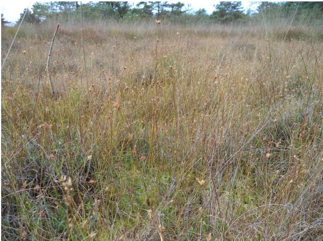
Foto 2.2 Slenkvegetatie met Witte snavelbies in het deelgebied noordhoek in het Fochteloërveen.

Aan elke lokale vorm is minimaal één Staatsbosbeheer Catalogustype toegekend. Bij keuze uit meerdere catalogustypen is de best passende gekozen of zijn twee catalogustypen toegekend, waarbij het eerste type het meest kenmerkend wordt geacht. Voor enkele vormen bevat de Staatsbosbeheer Catalogus Vegetatietypen geen passende eenheid, deze hebben de code 400 'voorlopig onbekend' gekregen. In de toekomst zullen dergelijke vegetaties, bij een herziening van de Staatsbosbeheer Catalogus, mogelijk wel expliciet opgenomen worden. De vertaling naar de huidige SBB-Catalogus en de Vegetatie van Nederland is opgenomen in bijlage 1.