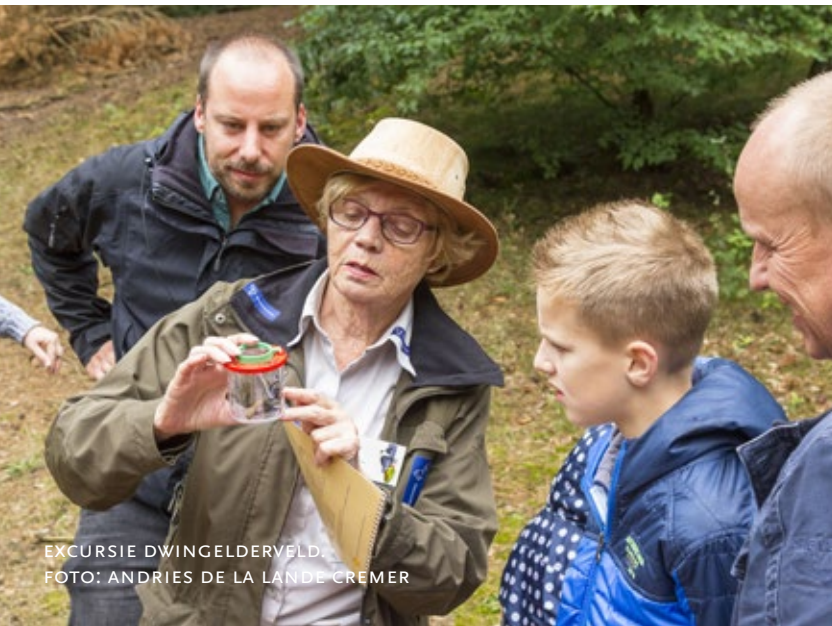
EXCURSIE DWINGELDERVELD.