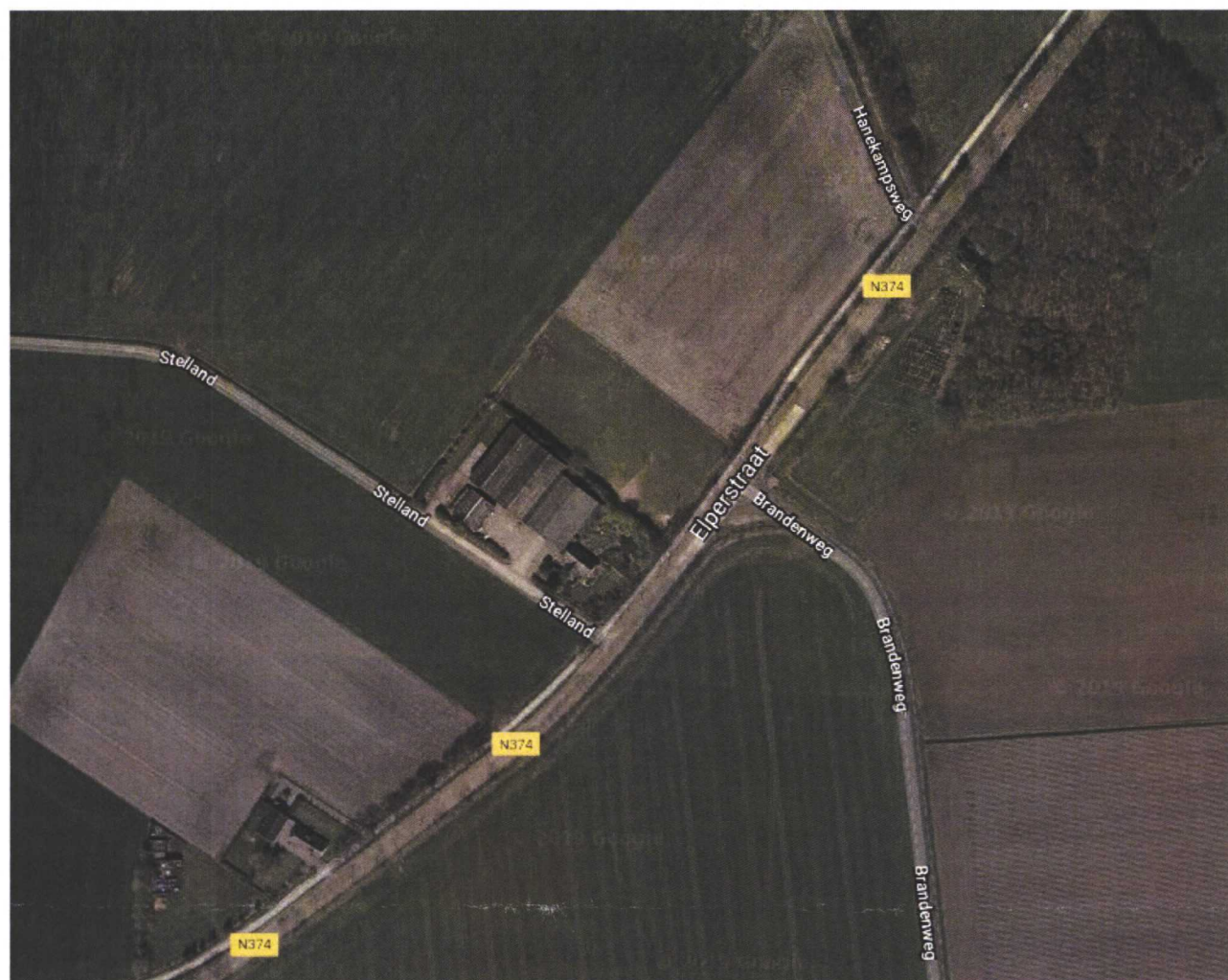
Afbeelding 2. Kaartaanduiding met satellietbeeld, uit Googlemaps d.d. 25 nov 2019.