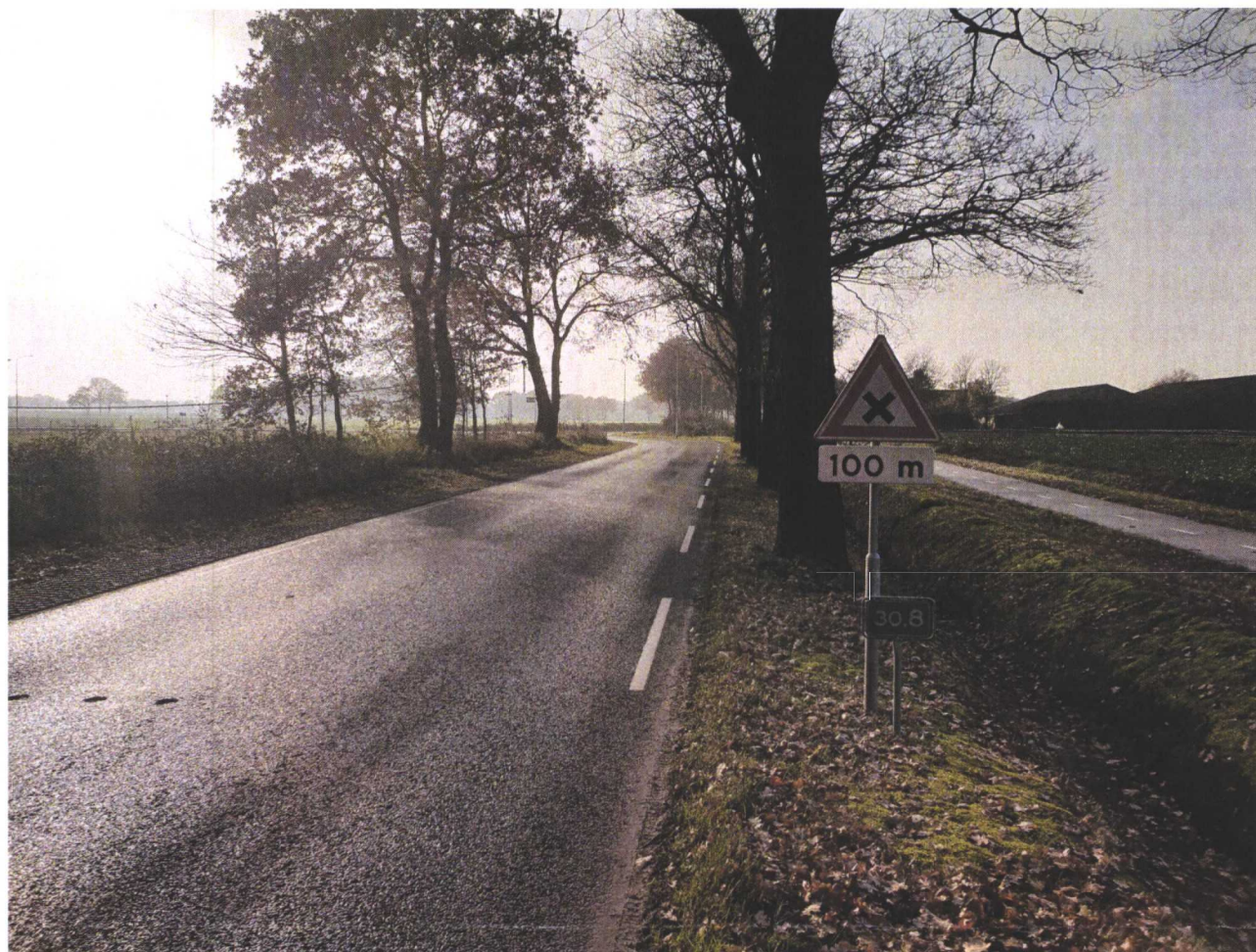
Afbeelding 4. Het zicht op de recent aangepaste verkeerssituatie tussen hectometerpaal 30,8 (nabij) en hectometerpaal 30,9 (verderop).