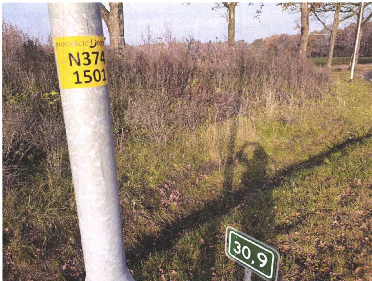
Afbeelding 3. Het aangebrachte talud met bebording, bij hectometerpaal 30,9.