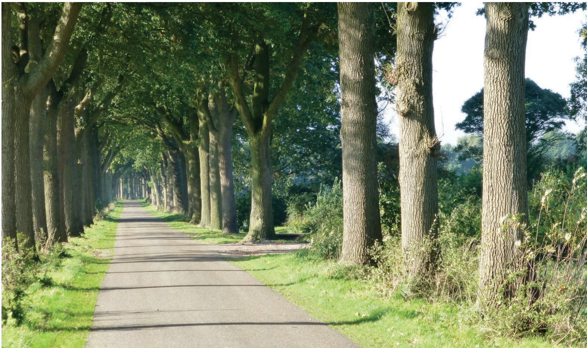
Koloniën van Weldadigheid