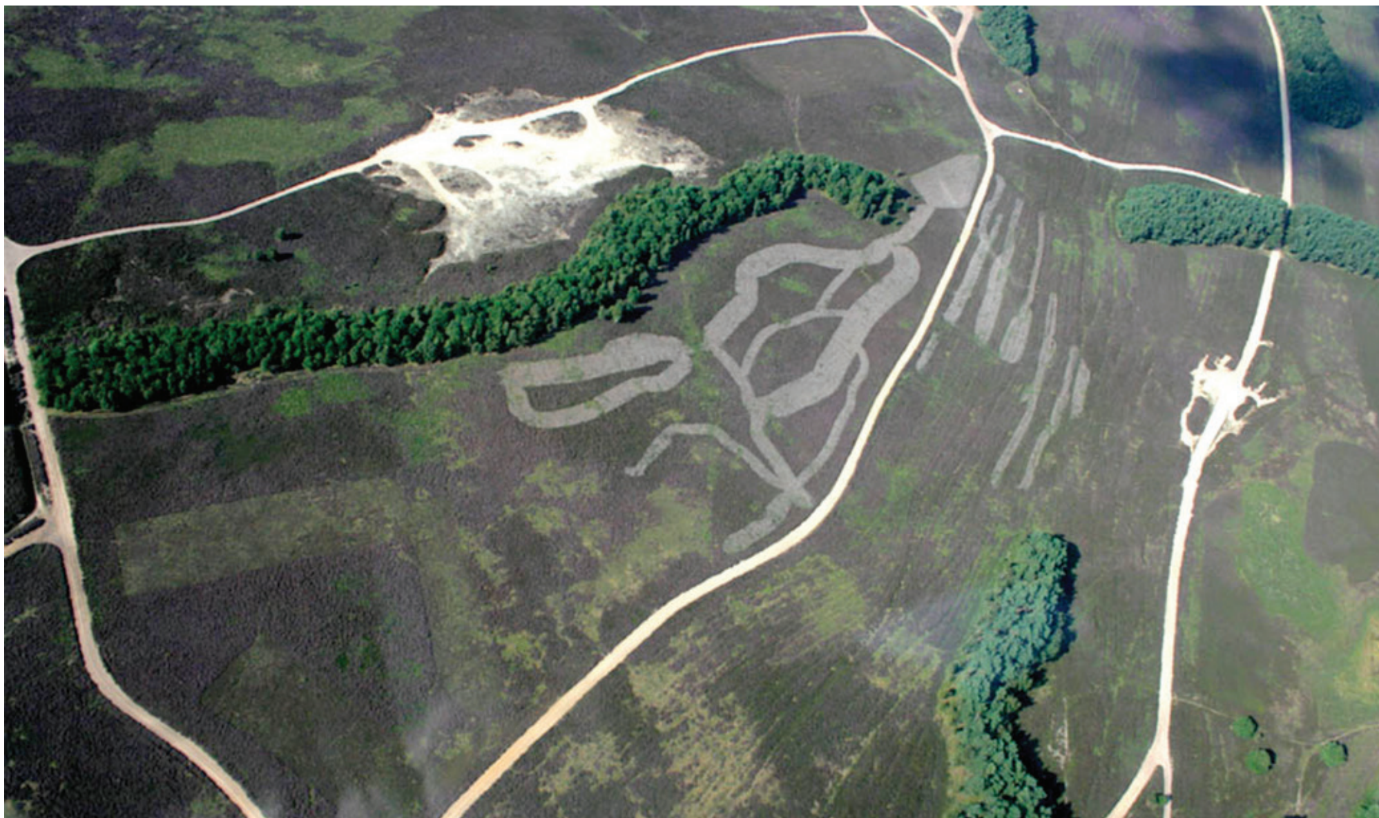
Middeleeuwse karrenspreien in het Balloërveld in de gemeente Aa en Hunze