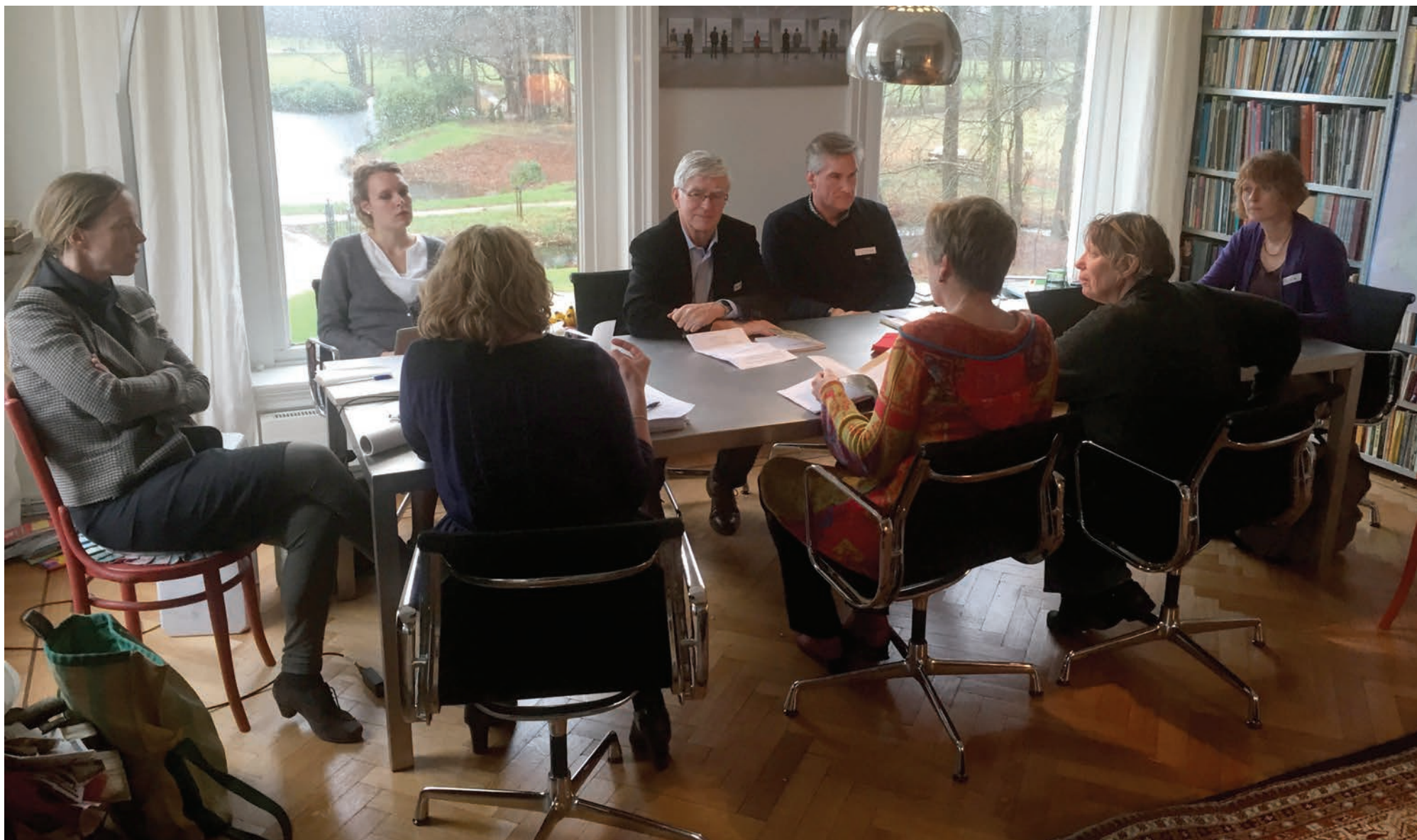
Rondetafel bijeenkomst, 15 januari 2015