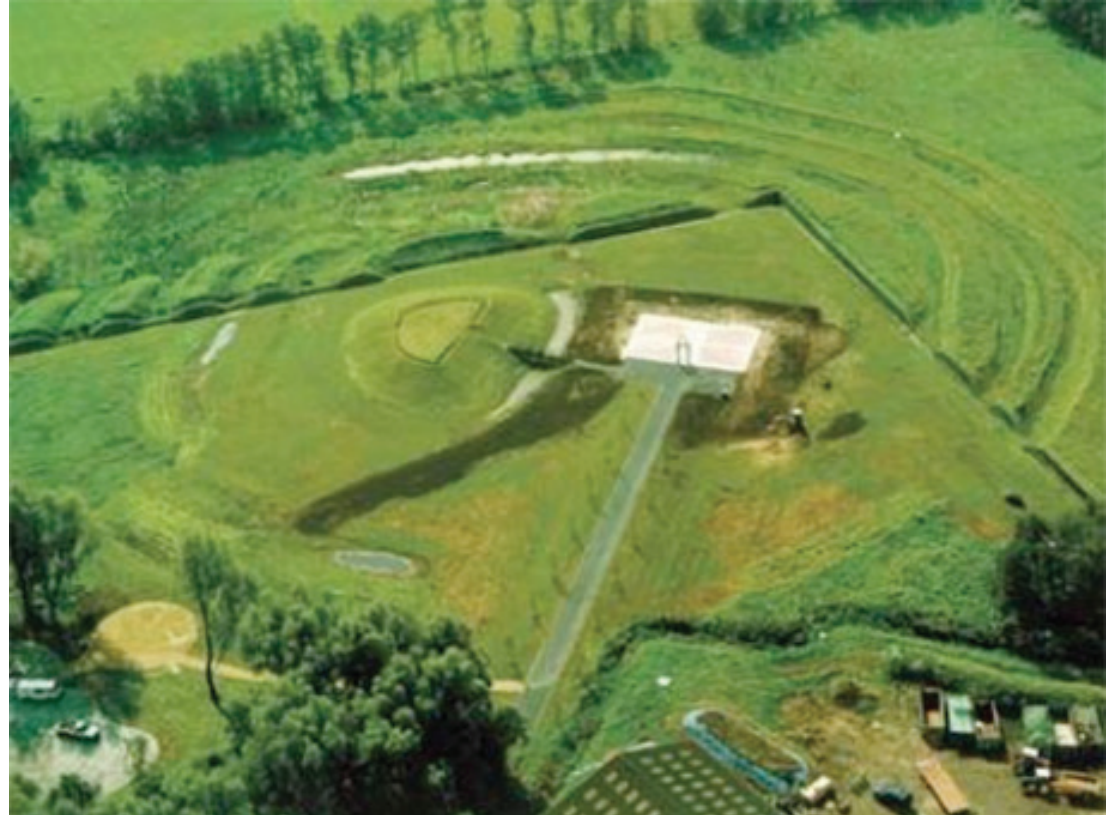
Heringerichte en gereconstrueerde waterburcht in Eelde