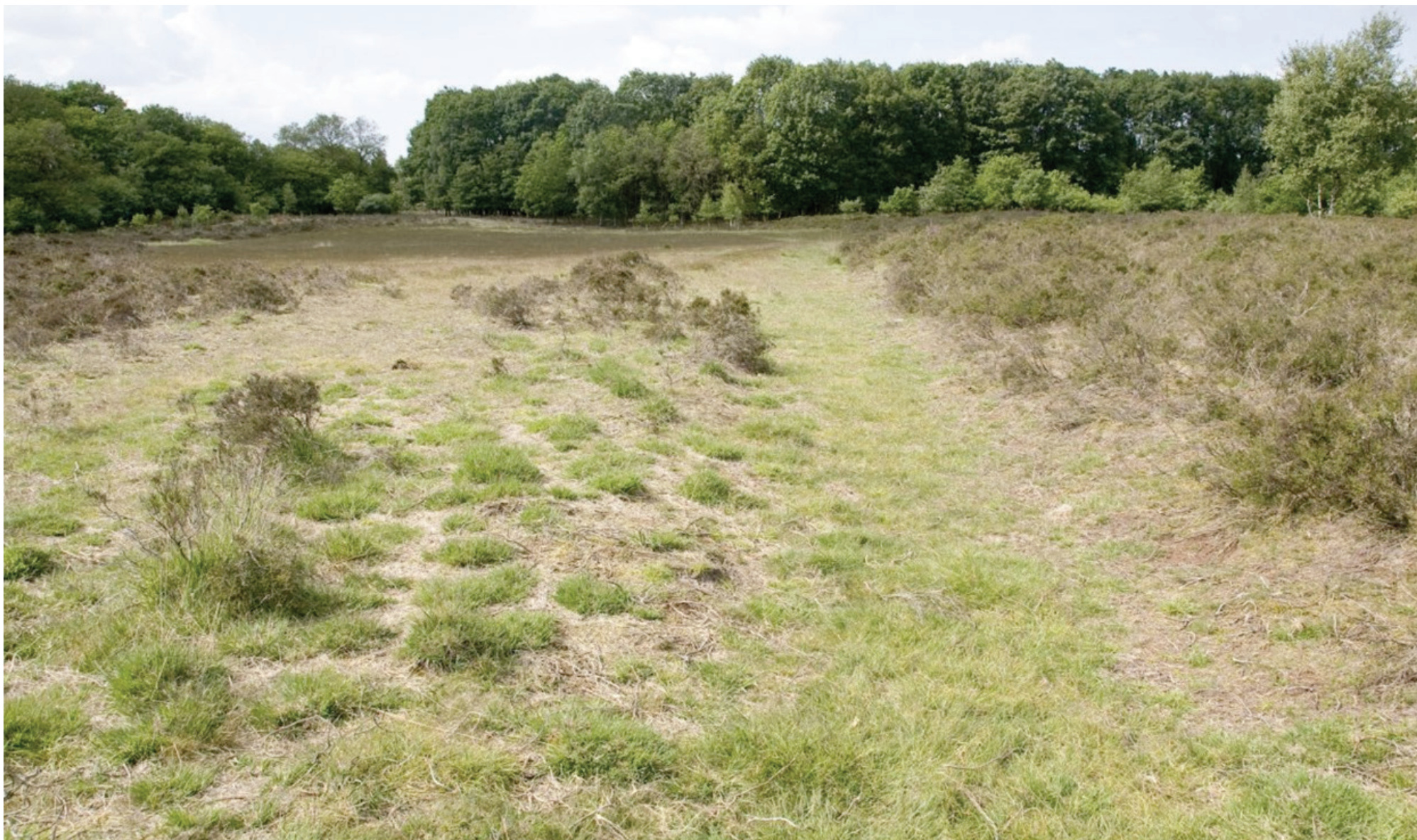
Strubben-Kniphorstbos (gemeente Aa en Hunze): het enige archeologische reservaat in Nederland