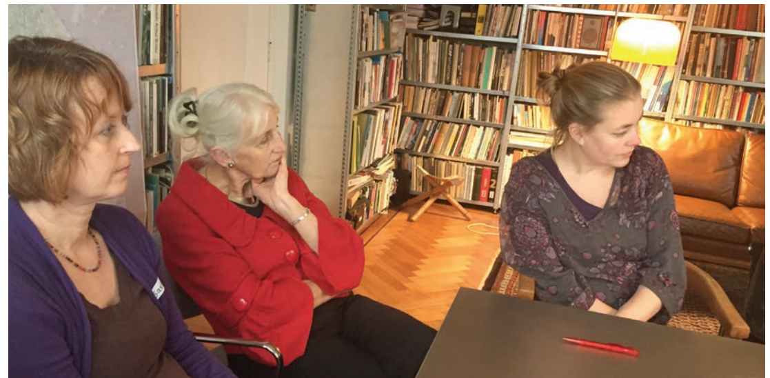
Rondetafel bijeenkomst, 15 januari 2015