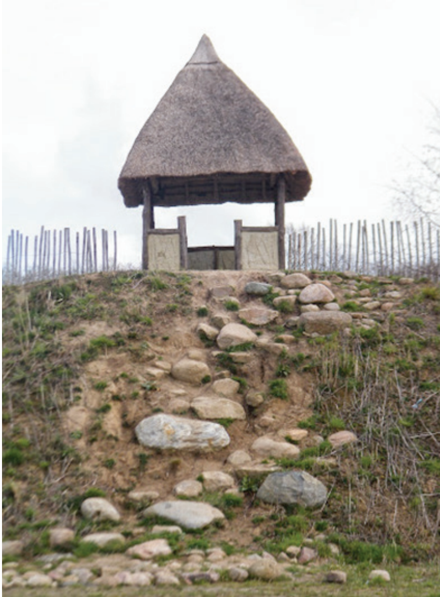
Spieker op de geluidswal N34