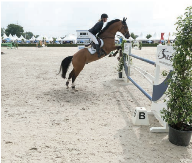
CH De Wolden, paardenfeesten