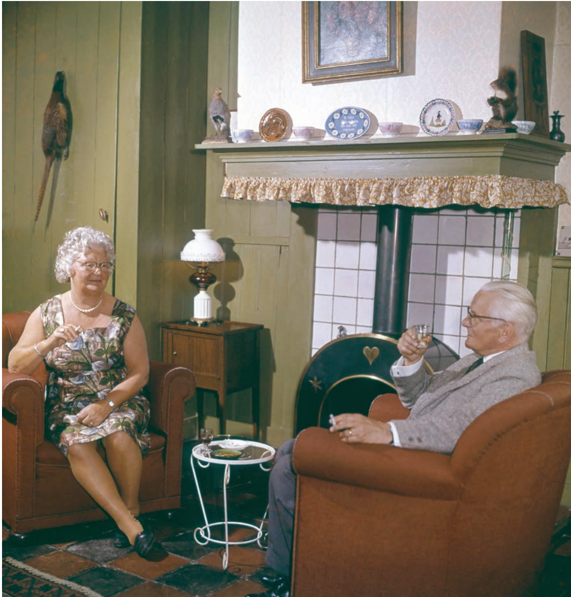
Marketing Drenthe in de jaren zestig: gepensioneerden met een neut en een solex

trekkelijk. Er is voldoende basiskwaliteit om te willen blijven investeren. (G1)