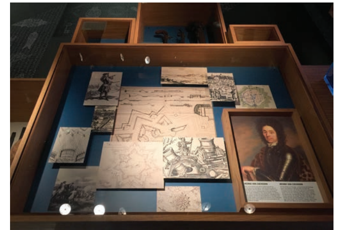
Stedelijk Museum Coevorden