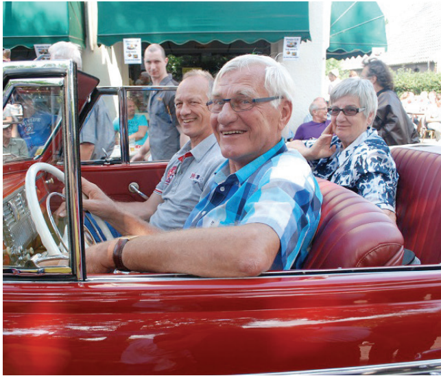
Classic cars Ruinerwold, Oldtimerdag