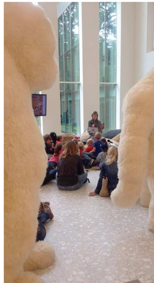
Centrum Beeldende Kunst Drenthe