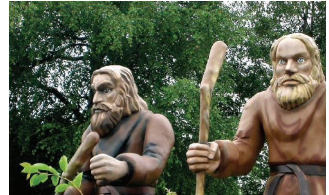
Ellert en Brammert

De historische verenigingen in Drenthe zijn relatief jong – meest gesticht in de jaren tachtig, negentig of later. Ze vormen de ‘consulaten’ van het Drentse erfgoed in de dorpen. Met hulp van vrijwilligers wordt het erfgoed ontsloten, bewaard, gepresenteerd en onder de mensen gebracht. Bij Ol Eel (Eelde) zijn bijvoorbeeld 70 vrijwilligers actief in het bestuur en de vele werkgroepen die deze verenigingen telt. De verenigingen doen onderzoek, verzorgen publicaties, geven tijdschriften uit, organiseren tentoonstellingen en bijzondere manifestaties. Daarbij kan van vereniging tot vereniging de nadruk verschillen – bijvoorbeeld op familiegeschiedenis en genealogie, volksverhalen, monumenten of bepaalde historische periodes. Veel verenigingen beheren eigen collecties van oude foto's en objecten. De meeste verenigingen ontvangen geen structurele subsidies, maar worden wel ondersteund – bijvoorbeeld met huisvesting of projectsubsidies. De verenigingen organiseren met regelmatig evenementen (lezingen), tentoonstellingen en excursies. In toenemende mate wordt de kennis via het internet toegankelijk gemaakt.