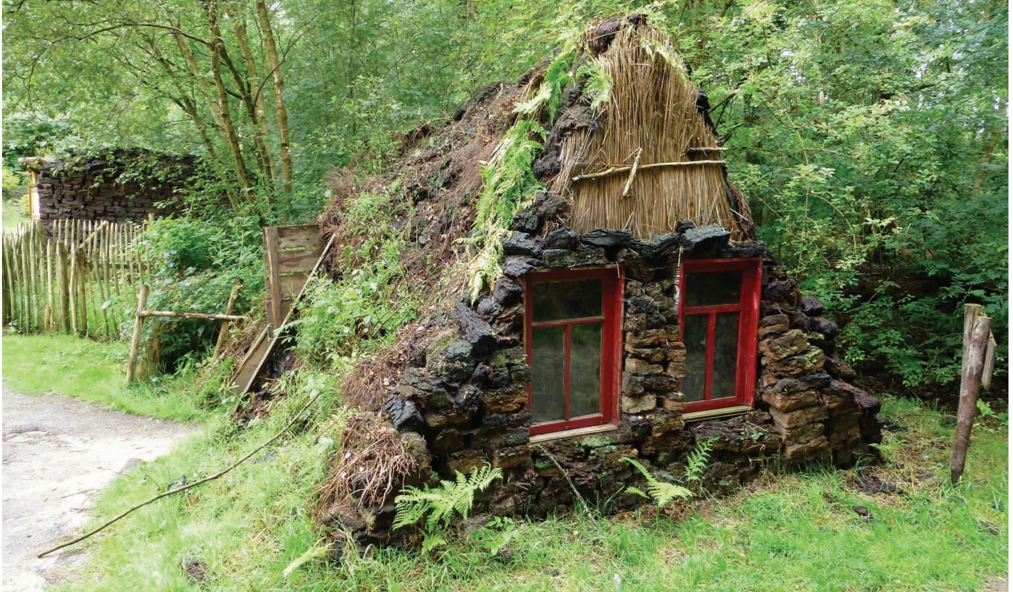
Plaggenhut, Veenpark, Barger-Compascuum