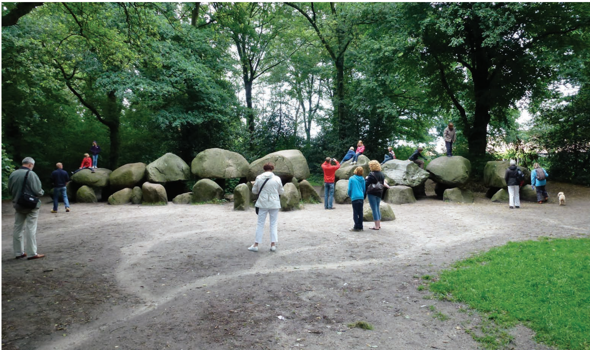
Hunebed in Borger