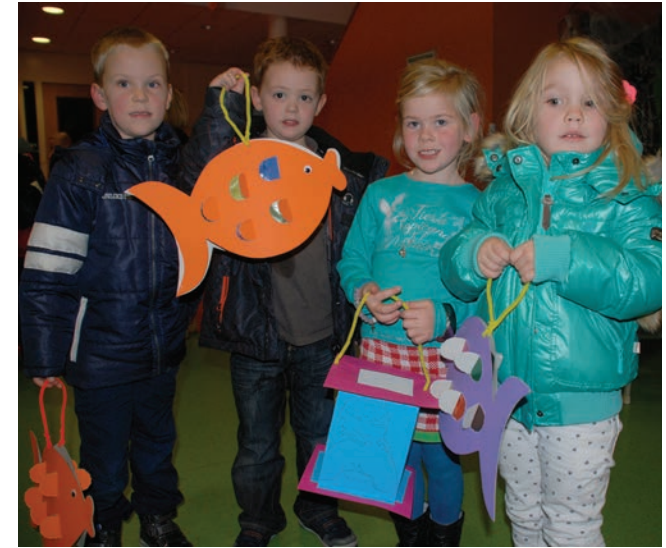
11 november, Sint Maarten