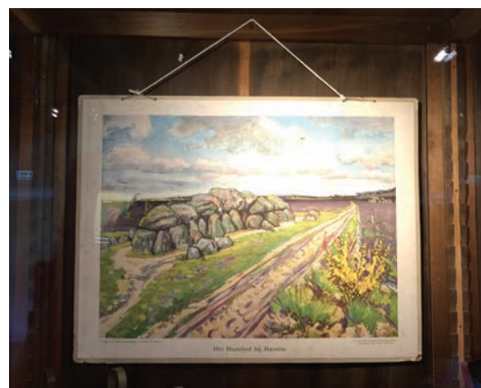
Museum Collectie Brands