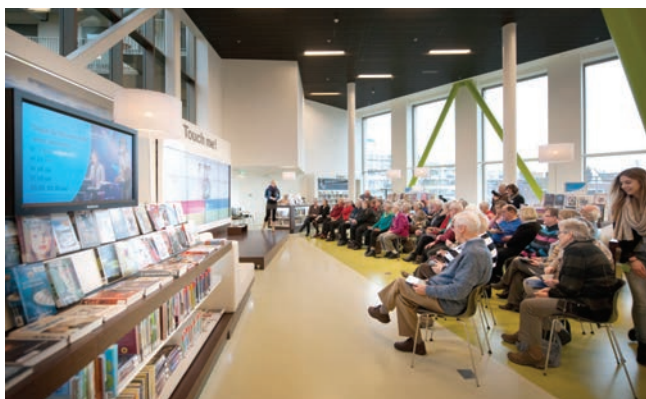
Cultureel centrum De Kolk, Assen