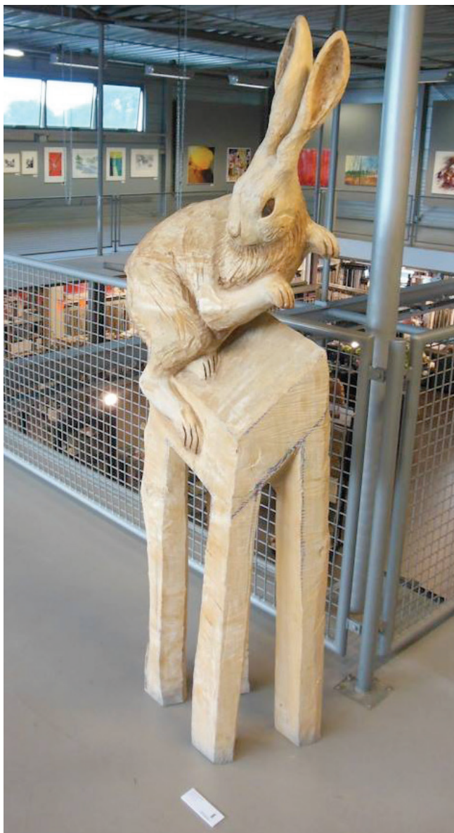
Centrum Beeldende Kunst Drenthe