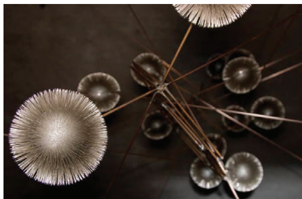
Centrum Beeldende Kunst Drenthe, Ronald van der Meijs