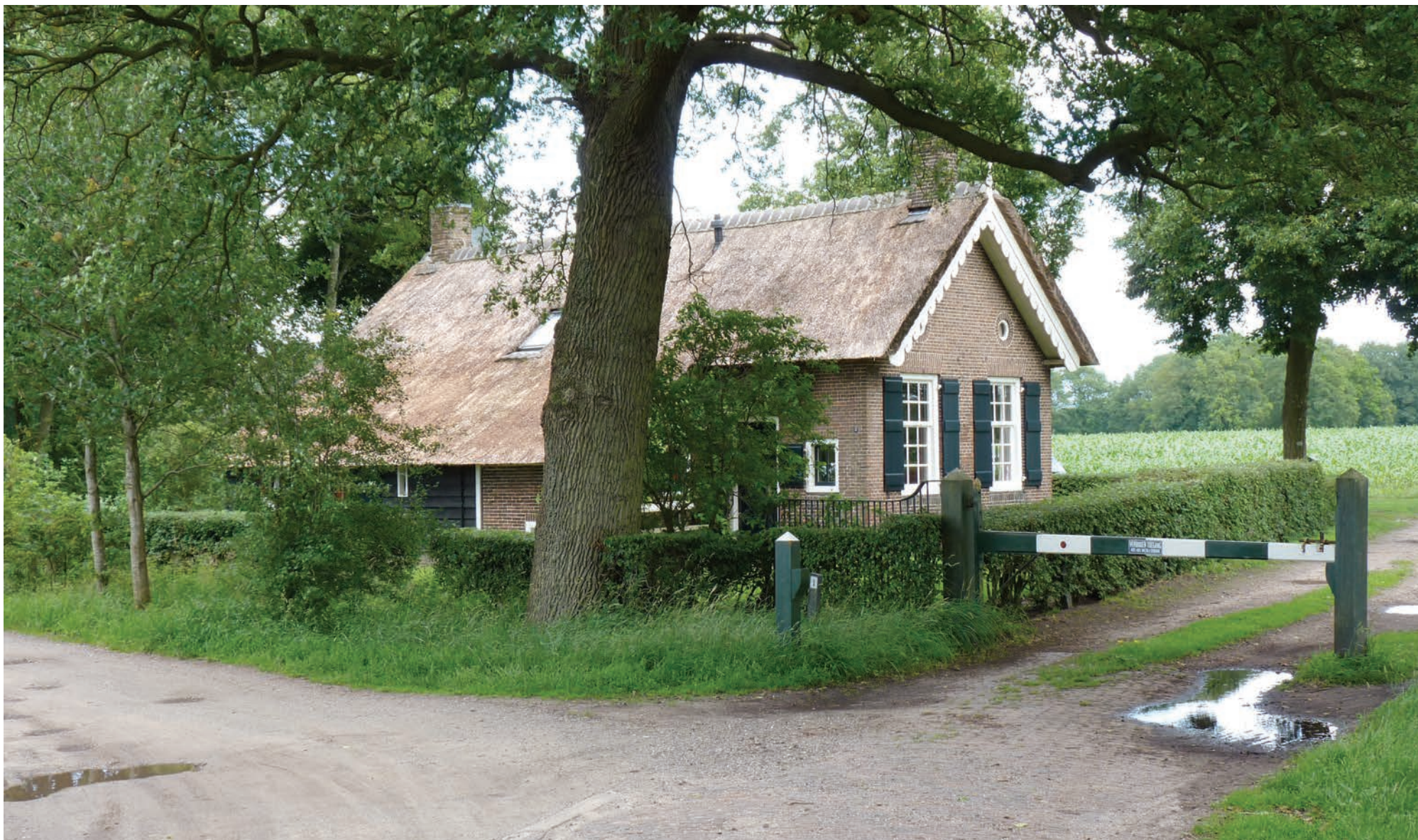
Tolhuis in Dickninge, bij de Wijk