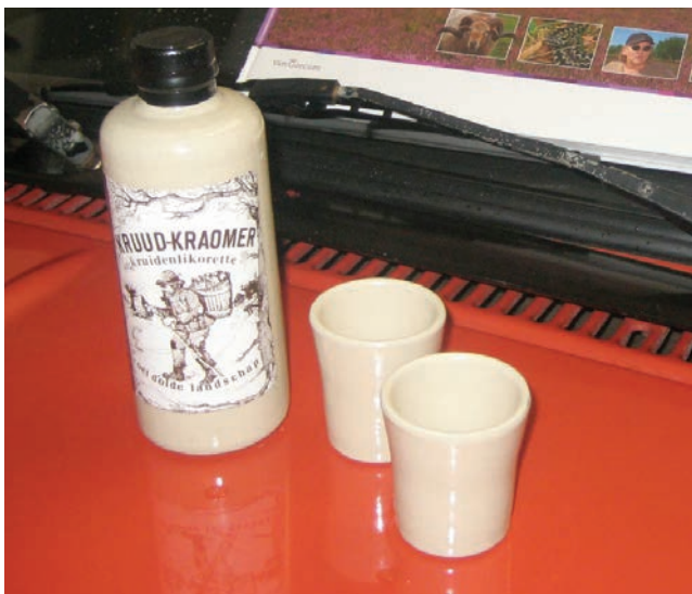
Kruud-Kraomer (Drentse kruidenbitter)