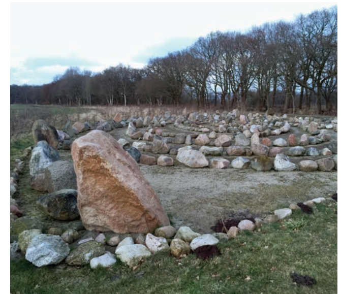
Vindplaats meisje van Yde