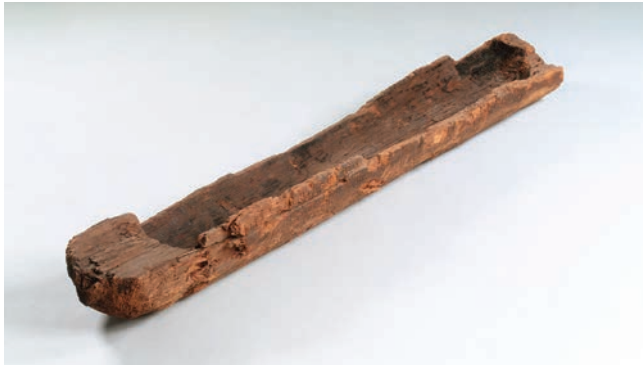
Kano van Pesse, Drents Museum