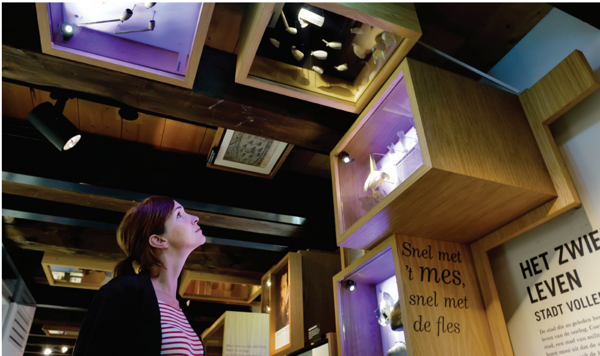
Stedelijk Museum Coevorden