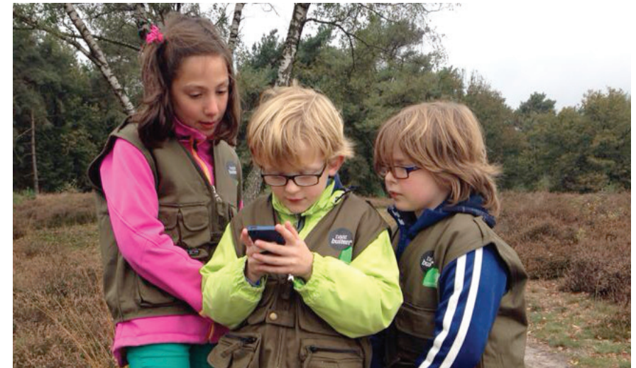
Glasvezel is het Rijkswegenplan van 21e eeuw