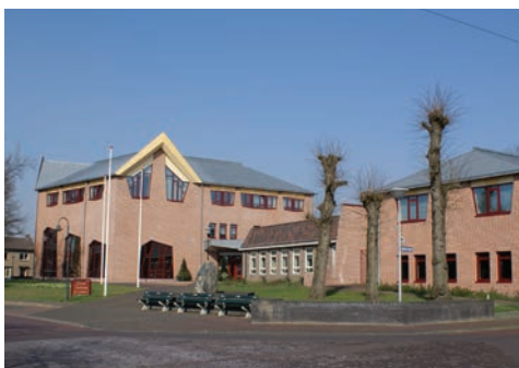
Gemeentehuis De Wolden