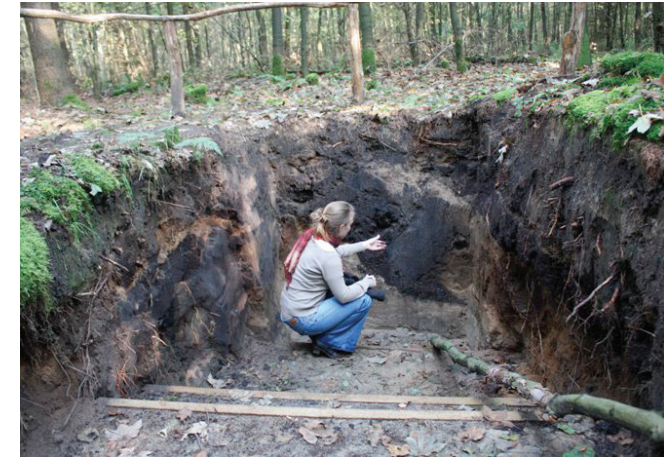
De mens in relatie tot het erfgoed

Ane vindt het Balloërveld één van de mooiste plekken van Drenthe. Met name de zichtlijn richting de toren van Rolde, deze is speciaal als men bedenkt dat er in al die tijd nooit iets in deze zichtlijn is gebouwd. Op het Balloërveld ervaar je de spanning van de weidsheid, de tijdsdiepte en de cultuur van Drenthe.