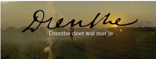
Drenthemomenten van Ellen ten Damme