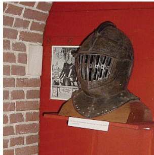
Kopie helm van Rabenhaupt