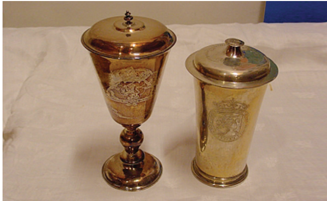
Avondmaalsbekers van Mijndert van der Thijnen