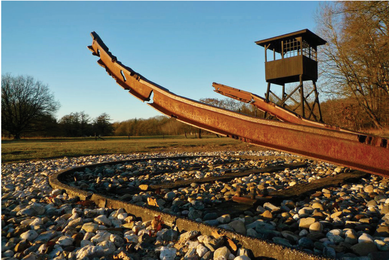
Nationaal Monument Westerbork, Ralph Prins

kan benutten voor het publiek. Dit wordt verbonden aan locaties en aan voor Drenthe onderscheidende onderwerpen. Bij de archieven ligt het accent op kennisontwikkeling en borging. De indruk is dat gemeenten niet altijd overtuigd zijn van de potentie van archieven als cultuurbeleving. Archeologie is over het algemeen goed geborgd in gemeentelijke plannen. Het is mogelijk om het archeologische verhaal van Drenthe beter uit te dragen, door onvoldoende capaciteit is dit momenteel echter nauwelijks mogelijk. De bescherming van de cultuurhistorie staat er in het algemeen redelijk goed voor, echter de provincie is afhankelijk van het beleid van de gemeenten. De cultuurhistorische waardenkaarten hebben niet in elke gemeente tot hetzelfde beleid geleid. Verder kan op het gebied van kennisontwikkeling nog een grote stap worden gemaakt, hiervoor is momenteel geen budget beschikbaar.