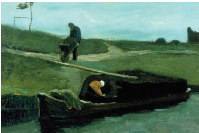
Vincent van Gogh (1883), De Turfschuit, Drents Museum

land zijn 'artistieke vaderland'. In kleine vissersdorpjes en plattelanddorpen vond hij de motieven die hem inspireerden. Hij raakte bevriend met veel Nederlandse kunstenaars, zoals de stichter van de Haagse School Jozef Israëls, die hem adviseerde een paar maanden naar Drenthe te gaan. Drenthe was in die tijd een heel dunbevolkt gebied met grote stukken ongerepte natuur en kleine boerendorpen: een schildersparadijs. In 1882 schilderde Liebermann witte lakens die in de zon te bleken lagen in een boomgaard in Zweeloo. Het zou een van zijn bekendste werken worden, dat zich nu bevindt in het Wallraf-Richartz museum in Keulen. Het schilderij in het Drents Museum is de studie voor het definitieve werk in Keulen. Voor Vincent van Gogh was Het grote Bleekveld de reden om ook in Zweeloo te gaan schilderen, in dezelfde boomgaard.