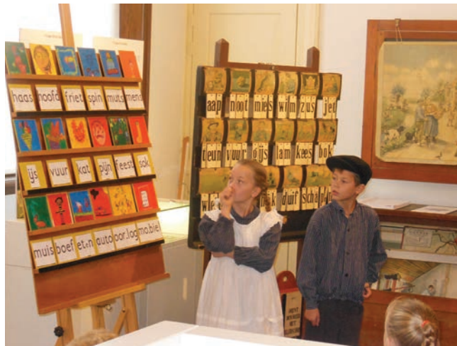
Scheepstra Kabinet, Stichting De Oude Scheepstraschool