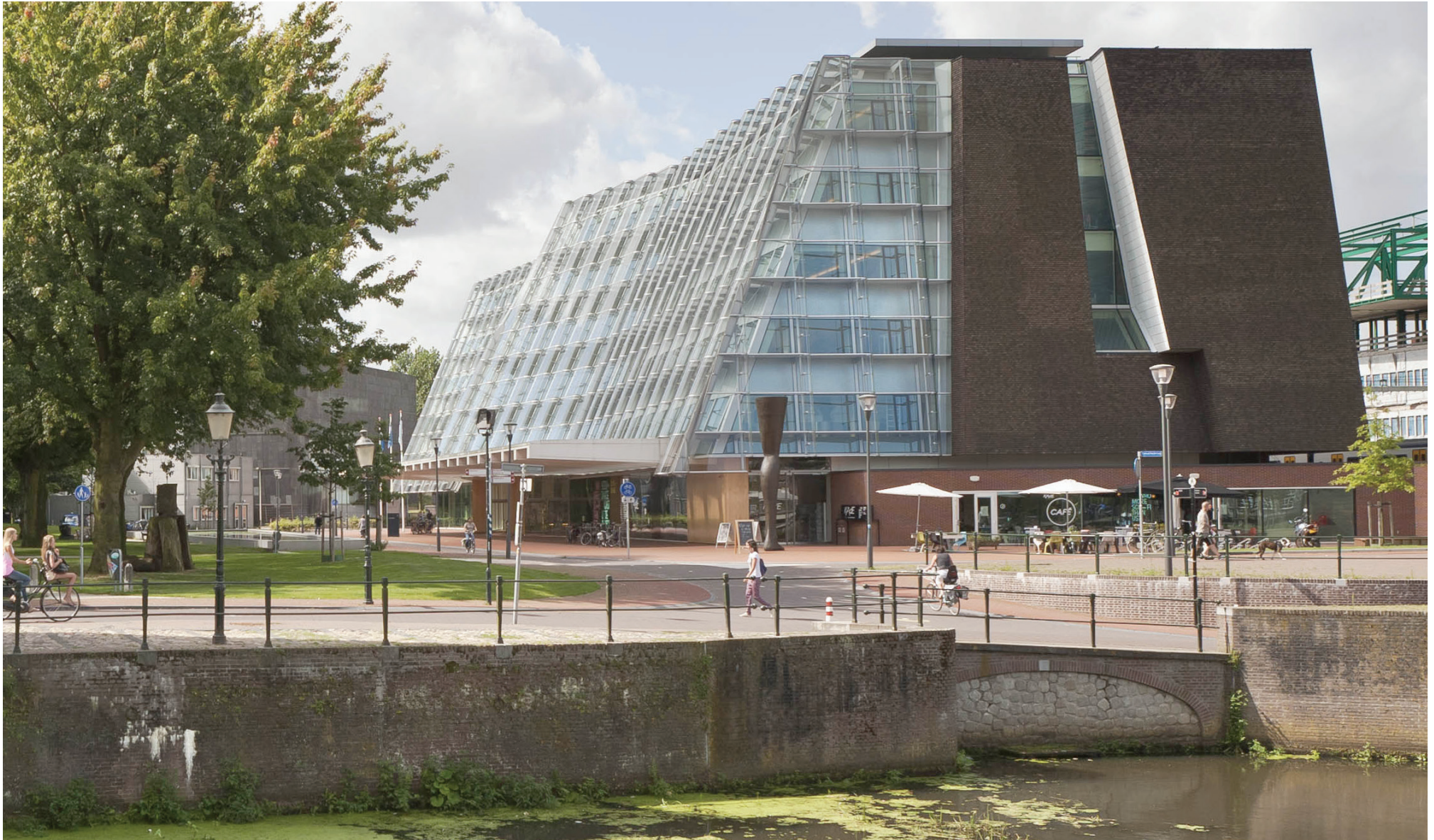
Rijksdienst Cultureel Erfgoed