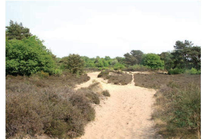
Subtiële hoogteverschillen in het Drentse landschap