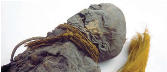
Meisje van Yde, Drents Museum