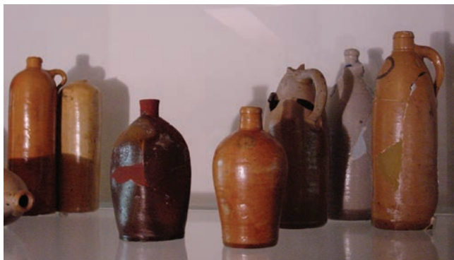
Diverse archeologische vondsten, Stedelijk museum Coevorden

Oudheidkamer Beilen: er worden verhalen voorgelezen in de streektaal, geschreven door onze overleden plaatsgenoot Roel Reijntjes.