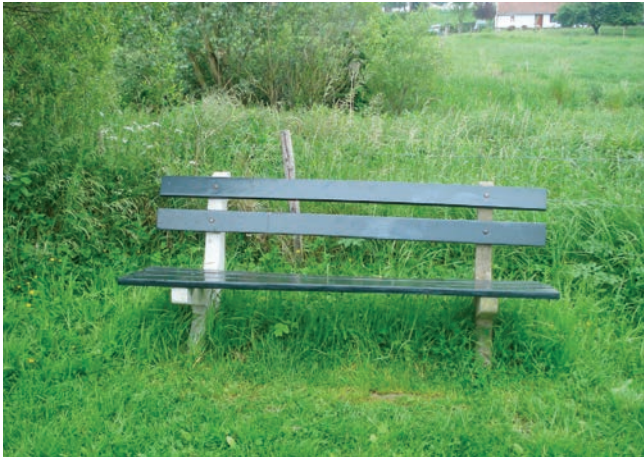
Op de Zuides van Gieten