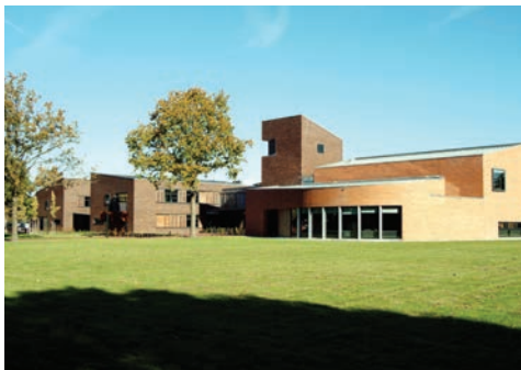
Gemeentehuis Aa en Hunze