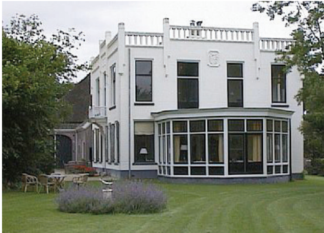
De Jufferen Lunsingh (Westervelde en omstreken)