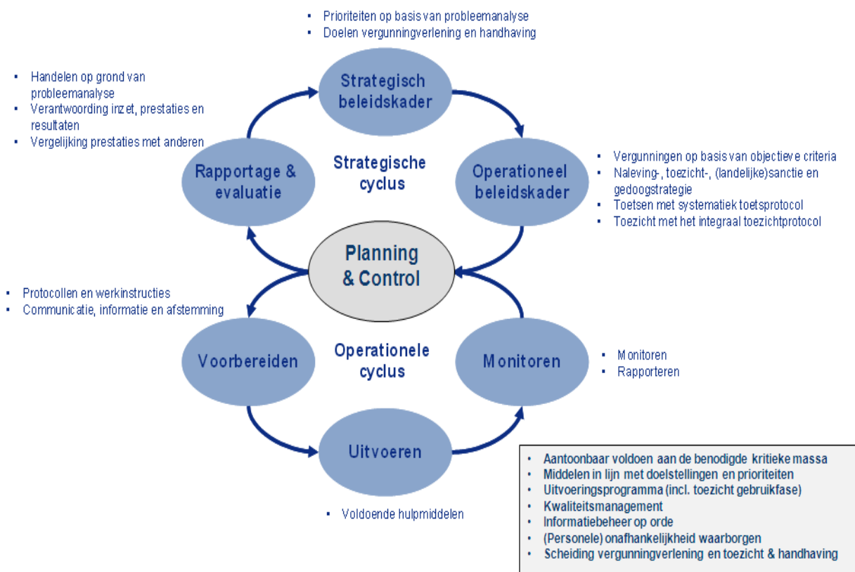
Figuur 1: de gesloten beleids- en uitvoeringscyclus conform de BIG 8

Centraal bij de gesloten beleidscyclus staan: