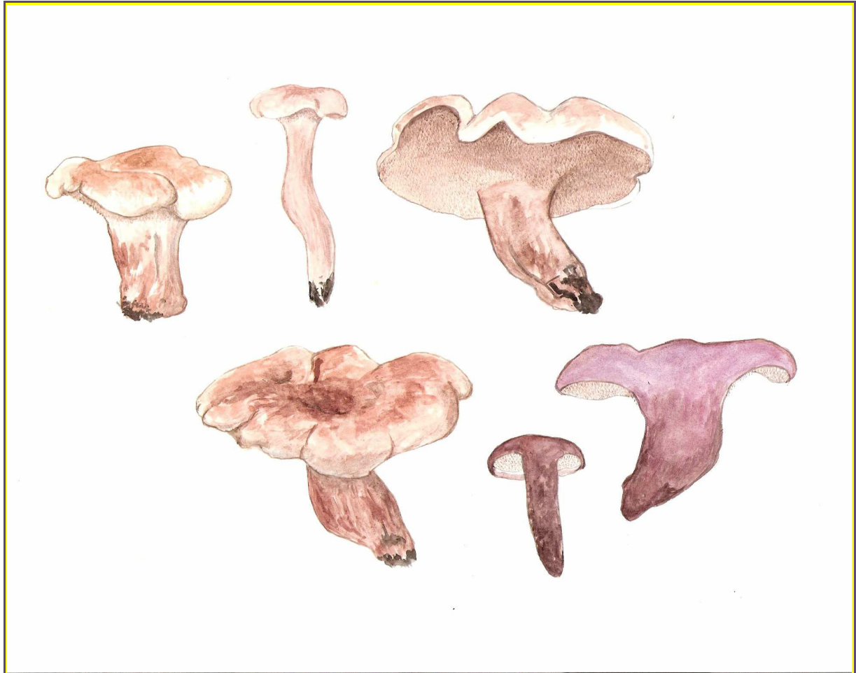
Avondroodstekelzwam, een zeer zeldzame en bedreigde paddenstoel van eikenlanen, in Drenthe recent van vier terreinen bekend

Op verzoek van de coördinator van het WAV-project zijn door ons de gegevens over vaatplanten in dit rapport opgenomen om alle relevante informatie over voor ammoniak gevoelige organismen in Drenthe te bundelen.