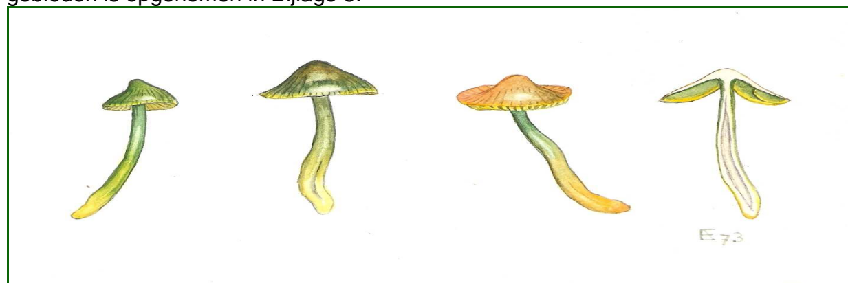
Pepegaaizwammetje, een gevoelige soort van schrale graslanden

Een overzicht van het totale aantal doelsoorten van vaatplanten voor alle WAV-gebieden is opgenomen in Bijlage 5.