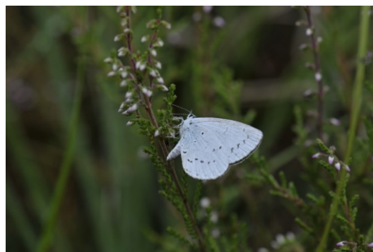
23 Boomblauwtje (eitjes leggen)