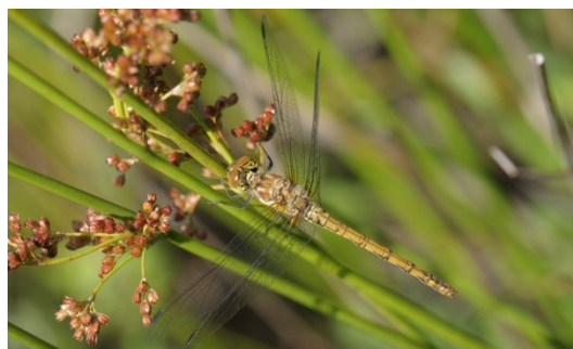
14 Steenrode heidelibel