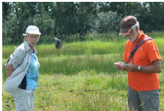
9 GPS administratie

Dit is het terrein dat normaal alleen met laarzen kan worden bezocht. Nu was al het water vrijwel opgedroogd. Aan de westrand vooral veel Ruwe smele.