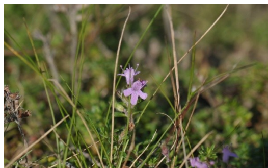
21 Echte thijm