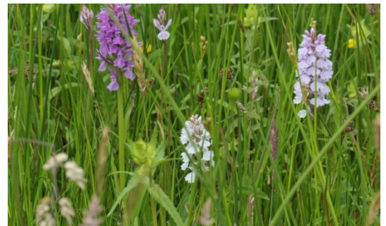
8 Massale orchideeën weelde

In dit gasterrein doen we veel aanvullende kennis op van orchideeën en planten op voedselarme vochtige grond.