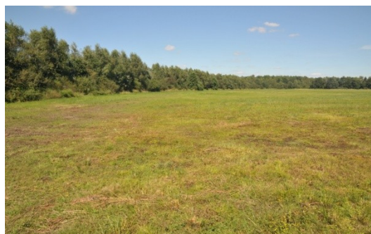
17 Vloeiweiden gemaaid

Net gemaaid terrein, waarbij alleen de uiterste randen nog iets interessants op kunnen leveren.