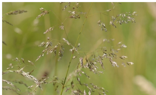
12 Ruwe Smele