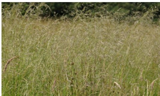
13 Ruwe Smele