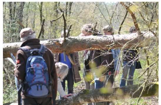
2 Natuur neemt het pad terug!

We hebben ook nog een kleine en een grote (22 pijpen) dassenburcht gezien.