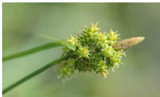
10 Pilzegge, vergroeide vorm