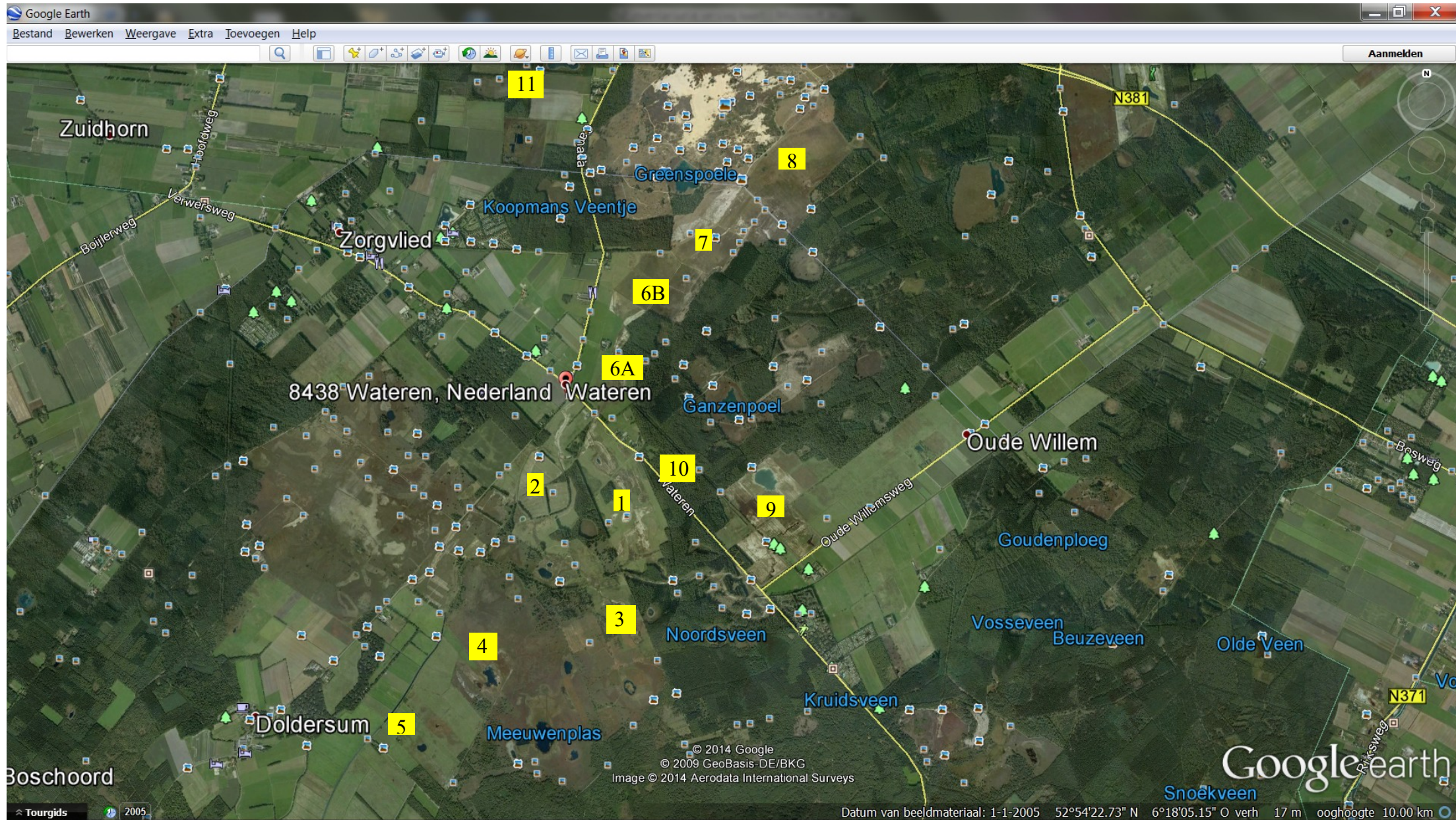
Overzichtskarta van het gebied