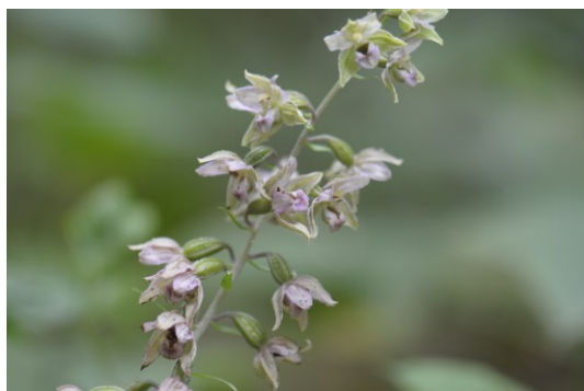
24 Brede wespenorchis

Van SBB is nog een lijst met 36 SNL soorten gekregen die vooral in een bosomgeving voorkomen. Van deze lijst zijn er maar liefst 33 niet aangetroffen maar deze komen in het aangewezen gebied dan ook niet voor en naar onze bescheiden mening ook op termijn niet te verwachten.