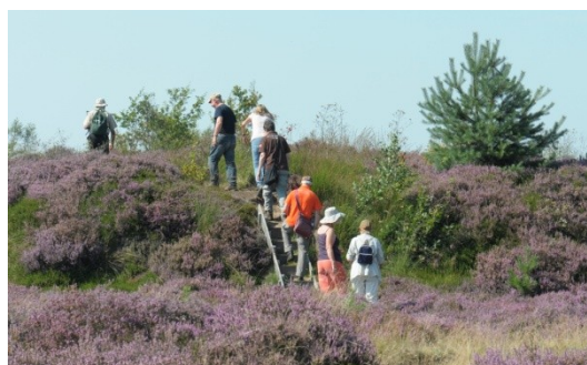
18 Schaopedobbe, trap naar het water

De kraaiheide bloeide nog mooi en in ieder geval hebben we nog gezien wilde kleine thijm, drijvende waterweegbree, grote en moeraswolfsklauw, kleine en ronde zonnedaauw, kruipbrem, klokjesgentiaan en wateraardbei best nog leuke plantjes zo laat in het seizoen.