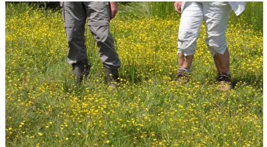
5 Tapijt van Egelboterbloem