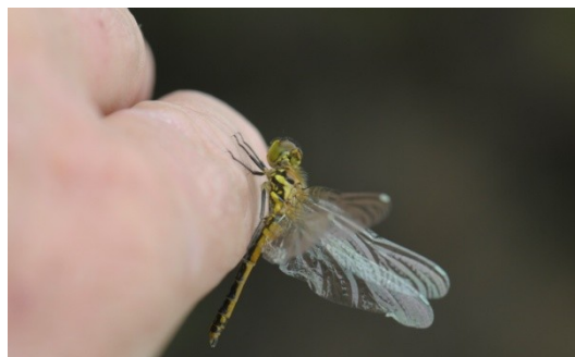
16 Zwarte heidelibellenvrouw