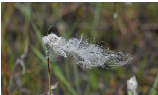
11 Veenpluis op reis