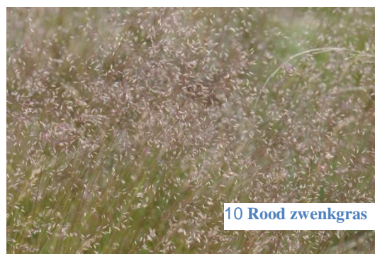
10 Rood zwenkgras