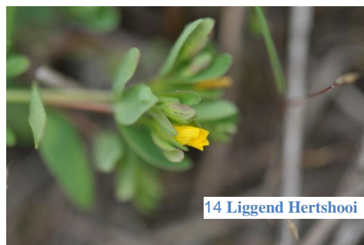
14 Liggend Hertshooi