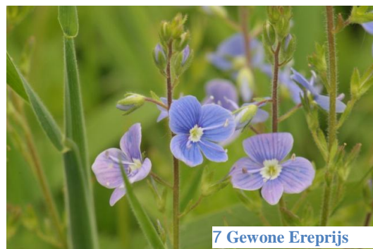
7 Gewone Ereprijs