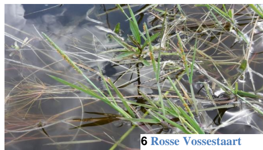
6 Rosse Vossestaart