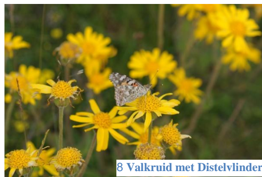
8 Valkruid met Distelvlinder

meegaan, dit in verband met de vergunning.