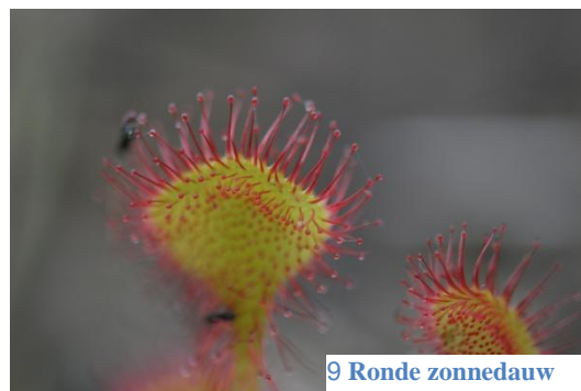
9 Ronde zonnedauw