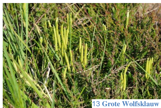
13 Grote Wolfsklauw

We hebben veel Grote Wolfsklauw gezocht en gevonden. We wisten van 2 jaar geleden dat het hier ergens moest staan. Deze zijn door Age veelvuldig op foto vastgelegd. Hier is op het zandpad ook een grote hoeveelheid Liggend Hertshooi aangetroffen.