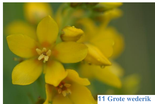
11 Grote wederik

Totaal 24 grassoorten is toch best een goede score in de regen.